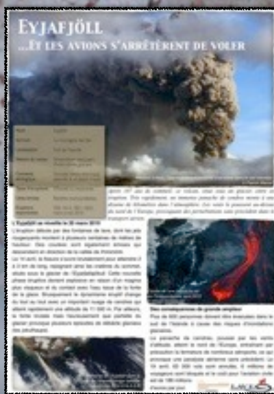
2- Volcans remarquables