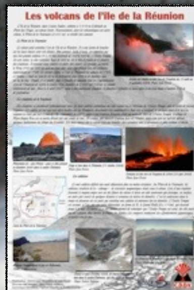
3- Volcans actifs d'Europe