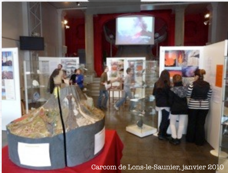
Carcom de Lons-le-Saunier, janvier 2010

Trois expositions indépendantes, à la fois esthétiques et pédagogiques, permettent d'appréhender les phénomènes volcaniques dans leur spectaculaire diversité. Un exemple de panneau de chaque exposition est présenté ci-dessous.