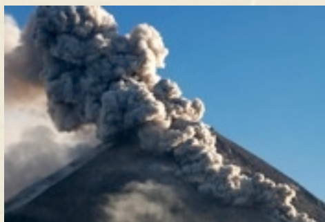
Nuée ardente dévalant les flancs du Merapi, Indonésie.