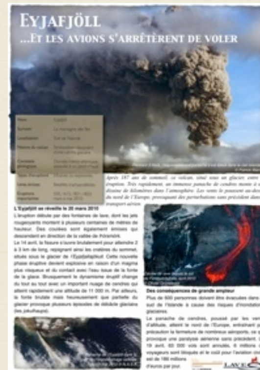
Panneau sur le volcan islandais «Eyjafjöll».

UNE EXPOSITION DE L' ASSOCIATION VOLCANOLOGIQUE EUROPÉENNE