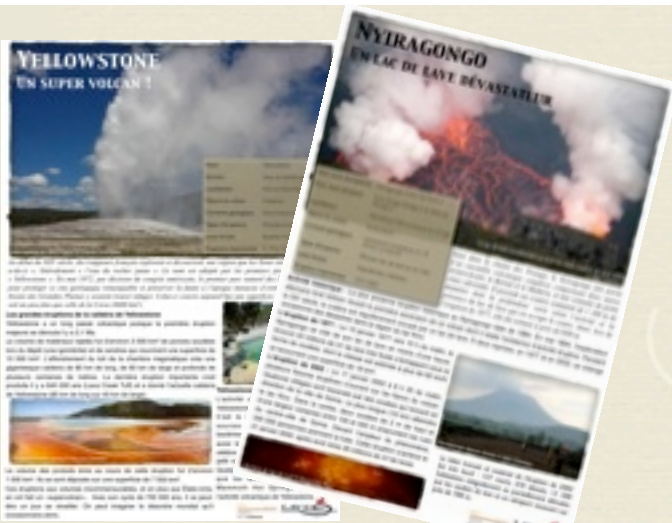
Deux exemples de panneaux de l'exposition : « Yellowstone », et « Nyiragongo ».