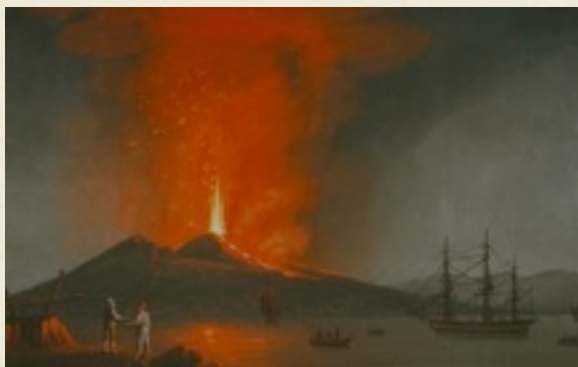
Gouache napolitaine montrant le Vésuve en éruption.

L'Association Volcanologique Européenne ( L.A.V.E. ) propose cette nouvelle exposition, élaborée pour la Maison de la Science de Sainte-Savine (Aube) en 2010. Constituée de 23 panneaux, elle vous fera découvrir quelques volcans remarquables à différents titres, qui ont marqué l'histoire des hommes et des civilisations, inspiré les artistes, ou particulièrement surveillés en raison de leur passé tumultueux.