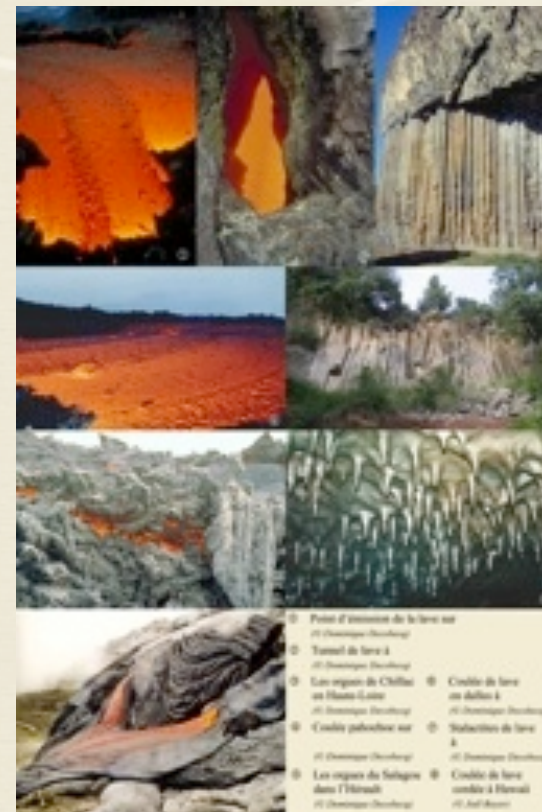
Panneau «les coulées de laves».

UNE EXPOSITION DE L' ASSOCIATION VOLCANOLOGIQUE EUROPÉENNE