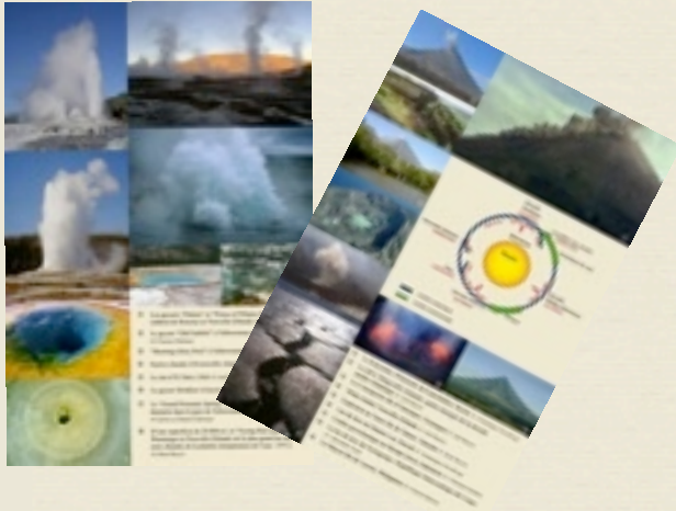
Deux exemples de panneaux de l'exposition : «Geysers», et «volcanisme et tectonique des plaques».