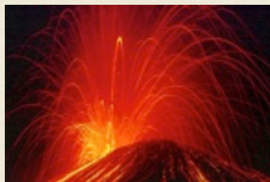
Krakatoa en éruption, Indonésie.