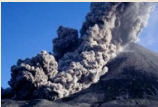
Coulée pyroclastique sur le Karymsky, Kamchatka

L'Association Volcanologique Européenne ( L.A.V.E. ) propose une exposition complète sur le volcanisme. Constituée de 18 panneaux, elle est à la fois pédagogique et esthétique. Un film, montage d'images réalisées par les adhérents de l'association sur les volcans du monde entier, l'illustre de façon vivante et spectaculaire.