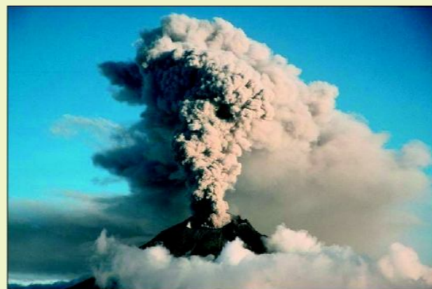
(Le volcan Tungurahua.)

Mettre à la portée de tous, de manière très accessible la description de ces phénomènes parfois complexes ainsi que le travail des spécialistes, favoriser la rencontre entre les volcanologues et le public tout en déclinant l'univers poétique que peuvent susciter les éruptions dans l'imaginaire collectif sont quelques uns des enjeux de cette manifestation.